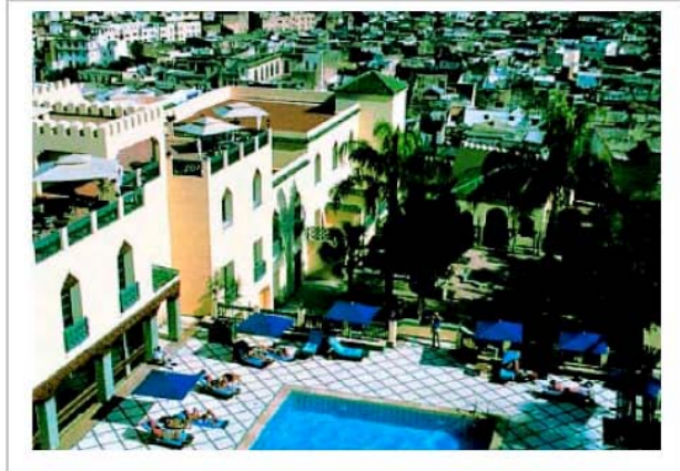
Sofitel Palais Jamai