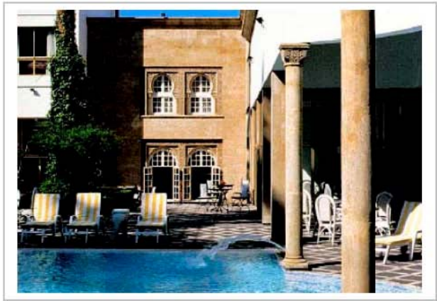
La Tour Hassan